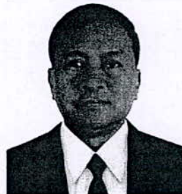
๘. พลเอก นิพัทธ์ ทองเล็ก อดีตปลัดกระทรวงกลาโหม