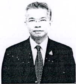
๑. นายรักษเกชา แฉฉาย อดีตเลขาธิการสำนักงานผู้ตรวจการแผ่นดิน

หากท่านใดมีข้อมูล ข้อเท็จจริง และข้อคิดเห็นเกี่ยวกับบุคคลที่จะเข้ารับการศึกษา เป็นผู้สมควรได้รับการแต่งตั้งเป็นผู้ตรวจการแผ่นดิน