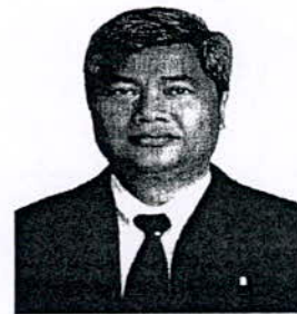
๖. นายสมชาย เจริญอำนวยสุข อดีตอธิบดีกรมส่งเสริม และพัฒนาคุณภาพชีวิตคนพิการ