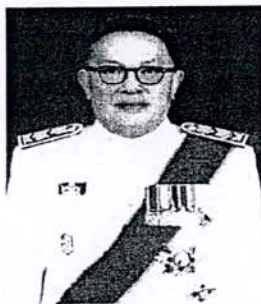
๕. นายธฤต จรุงวัฒน์ อดีตเอกอัครราชทูต ประจำกรุงอังการา สาธารณรัฐตุรกี