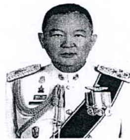
๒. พลตำรวจเอก คักดา เตชะเกรียงไกร อดีตผู้บังคับการโรงเรียนนายร้อยตำรวจ