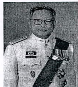
๔. นายกุลกมุท สิงหระ ณ อยุธยา อดีตเอกอัครราชทูต ประจำกรุงโซล ประเทศเกาหลีใต้