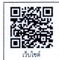
เว็บไซต์