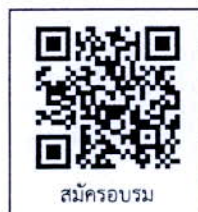
สมัครอบรม