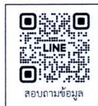
สอบถามข้อมูล