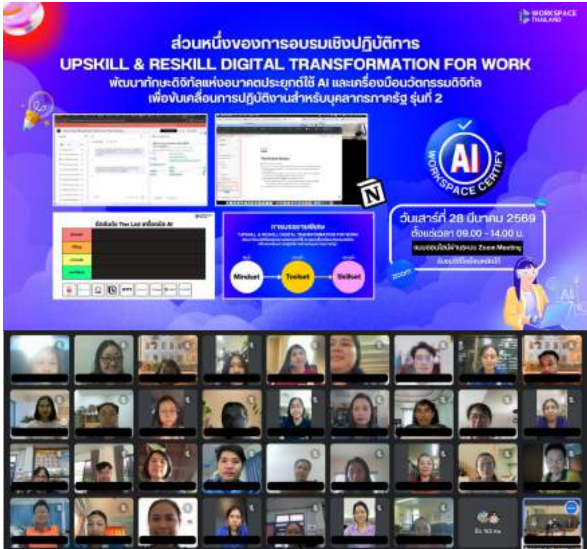
ภาพที่ 1 การอบรมที่ผ่านมาจัดโดยเวิร์คสเปซ ไทยแลนด์

การใช้รูปภาพเป็นไปตามข้อกำหนดตามพระราชบัญญัติคุ้มครองข้อมูลส่วนบุคคล พ.ศ. 2562