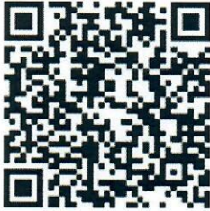
Google form ใบสมัคร

จึงเรียนมาเพื่อโปรดประชาสัมพันธ์และโปรดพิจารณาอนุมัติให้ข้าราชการและบุคลากรในสังกัดเข้าร่วมสัมมนาได้ตามวัน เวลา และสถานที่ดังกล่าว และขอขอบคุณมา ณ โอกาสนี้