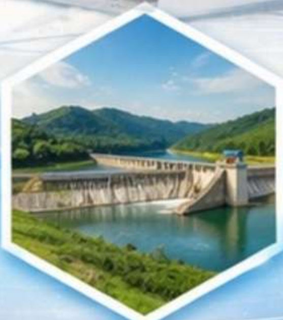
การจัดการน้ำ