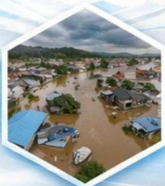
ภัยพิบัติ