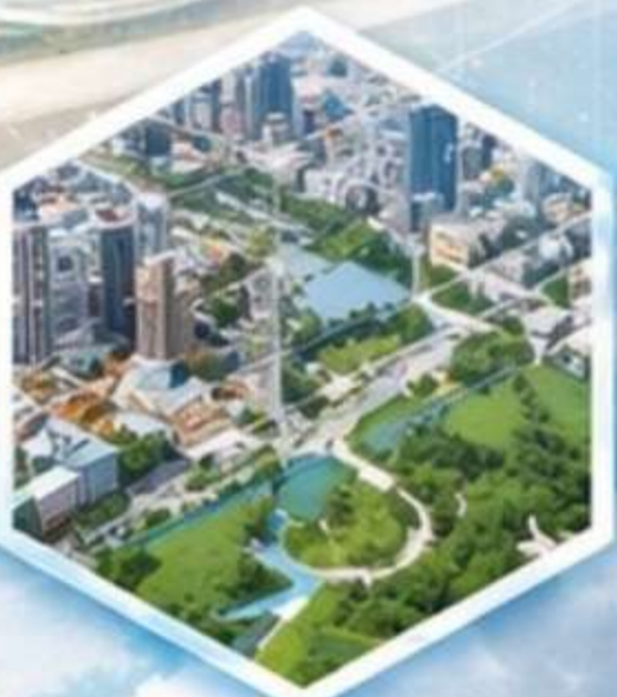
ทำแผนที่