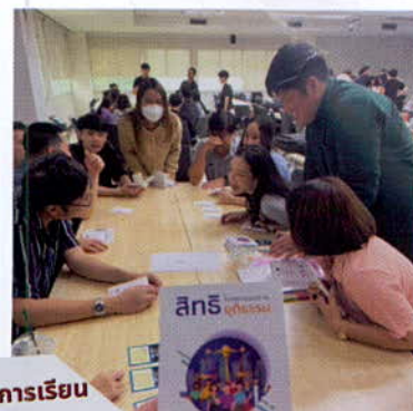
รูปแบบการเรียน Onsite