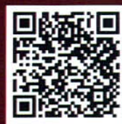
ประกาศรับสมัคร