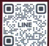
สอบถามรายละเอียด