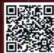
ระบบการรับสมัคร