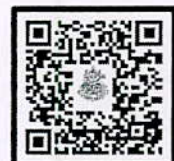
QR-Code สมัครอบรม

โทรศัพท์ ๐-๒๑๐๕-๔๖๘๖ ต่อ ๑๐๐๒๖๖ , ๑๐๐๒๙๒