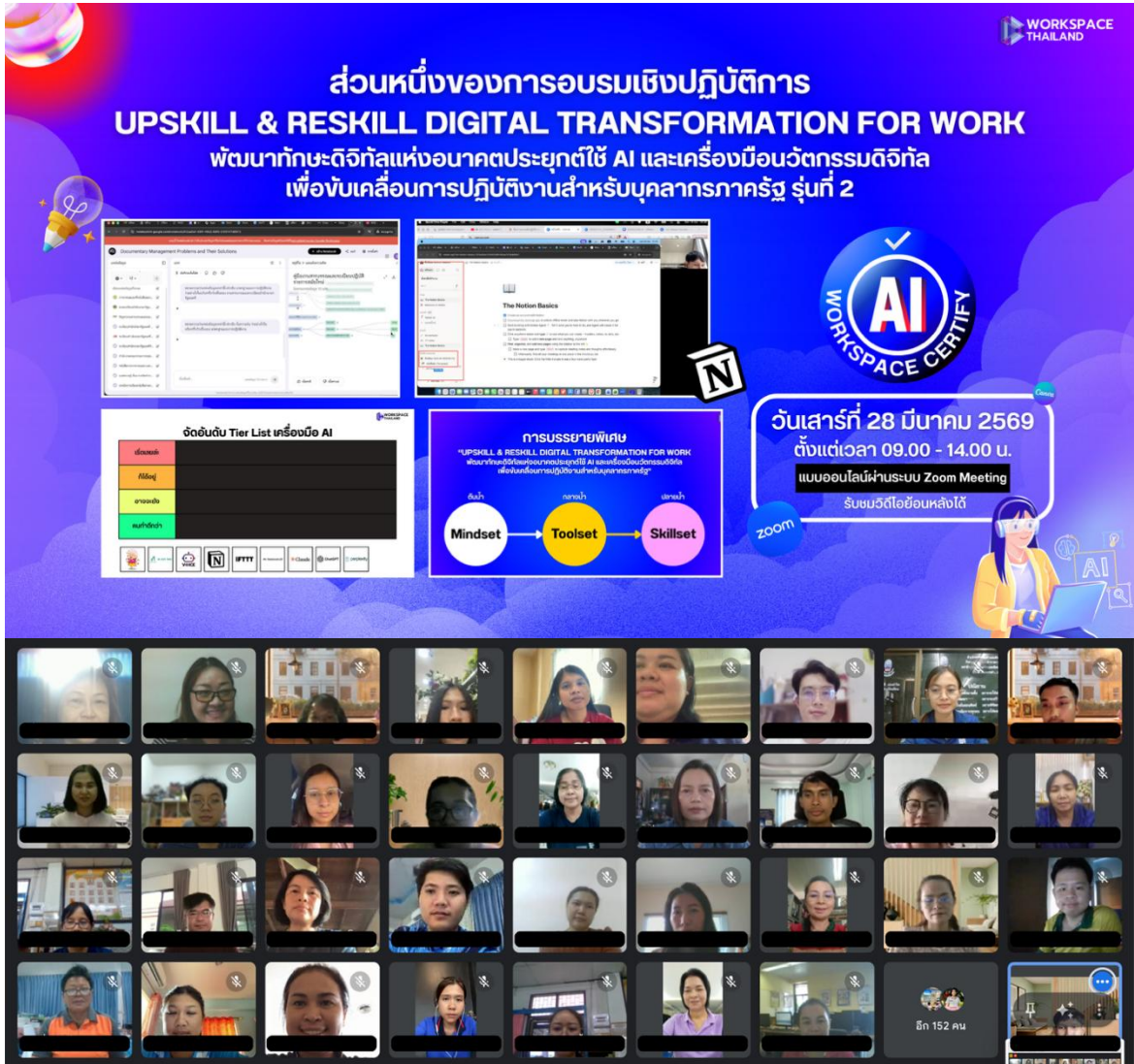
ภาพที่ 1 การอบรมที่ผ่านมาจัดโดยเวิร์คสเปซ ไทยแลนด์

การใช้รูปภาพเป็นไปตามข้อกำหนดตามพระราชบัญญัติคุ้มครองข้อมูลส่วนบุคคล พ.ศ. 2562