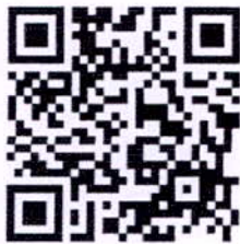
QR-Code ลงทะเบียน เข้าร่วมหลักสูตร GHG2