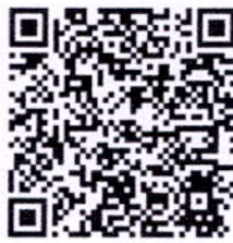
QR-Code เกี่ยวกับหลักสูตร GHG2