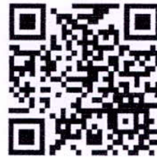
QR-Code ผู้ประสานงานหลักสูตร GHG2

หลักสูตร ความรู้พื้นฐานการจัดทำบัญชีรายการ และรายงานก๊าซเรือนกระจกตามมาตรฐาน ISO14064-1 และ ISO14067 แบบครบวงจร รุ่นที่ 2