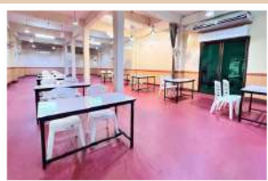
อาคารเพื่องฟ้า