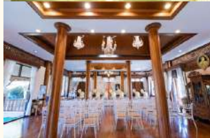
เรือนवानุรี 39,000 บาท