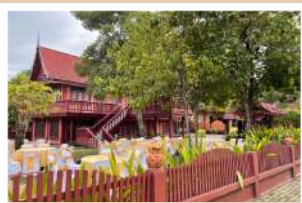
เรือนเปี่ยมสุข