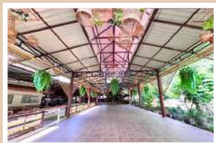
สวนเรือนสกุลไทย