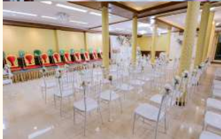
เรือนนสนสุพ 49,000 บาท