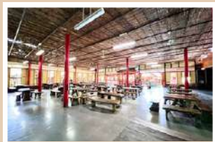
ศูนย์วัฒนธรรมไทย-จีน