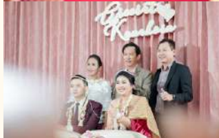
ศูนย์วัฒนธรรมไทยโบราณบ้านนางโสม 9,900 บาท