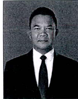
๔. นายอนุพร อรุณรัตน์ อดีตสมาชิกวุฒิสภา