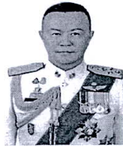
๒. พลตำรวจเอก ธีรยุทธ เพระาสุนทร ที่ปรึกษาพิเศษสำนักงานตำรวจแห่งชาติ